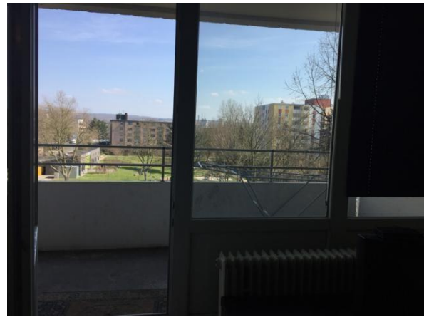
Blick aus dem Fenster mit dem großen Balkon

Für den Bewertungsbereich ist ein Bodenrichtwert von 235,- EUR/m 2 , GFZ = 2,8, MI-Gebiet, 4geschossig, 35 m Tiefe, ausgewiesen. Bei dieser Geschossbauweise ist also noch ein Zuschlag von 30% auf 305 Euro realistisch.