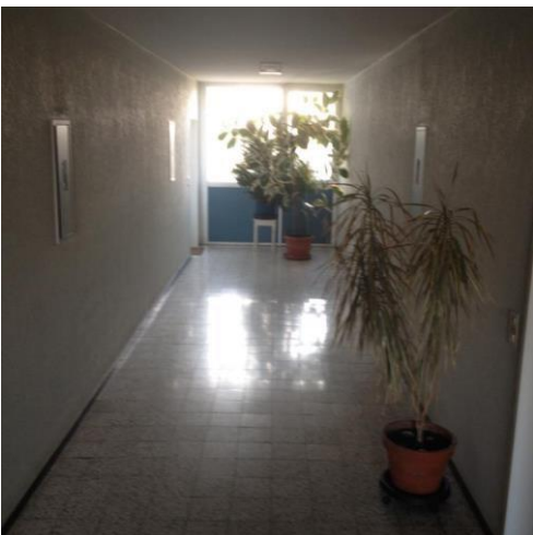
Flur im 5. Stock

Bodenwertanteil (von 4476m 2 insgesamt) bei je 2028/97.300 Miteigentumsanteilen Bodenwertanteil der Wohnung ist dann 93,10 mal 235€ gleich 21.878,68€.